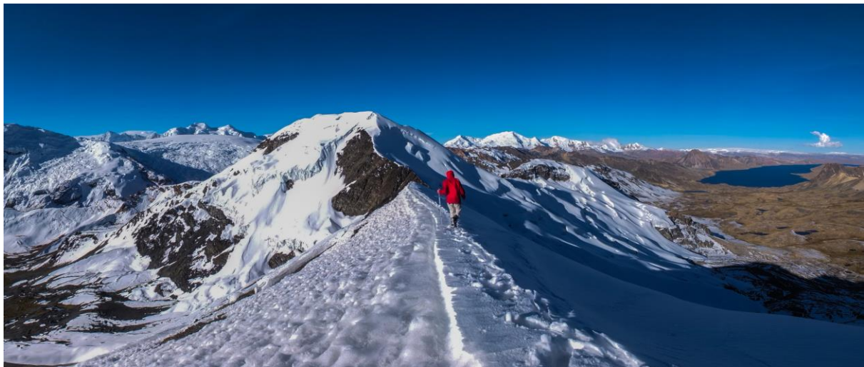
Sommet du Huayruro Punco

Temps de marche : 2 h 30 ou 6 h 00 selon option choisie Dénivelé : + 550, - 580 m avec l'ascension du Huayruro Punco