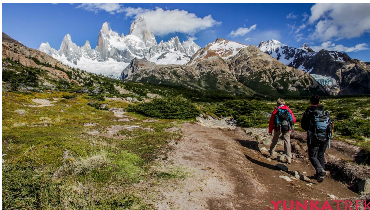
Approche du Fitz Roy