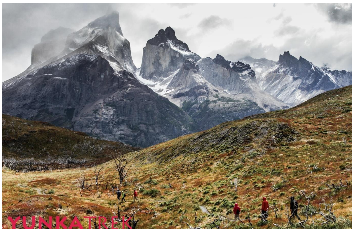
En direction de la vallée del Frances

Petit-déjeuner et dîner au refuge Paine Grande