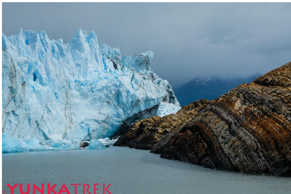
Glacier Perito Moreno