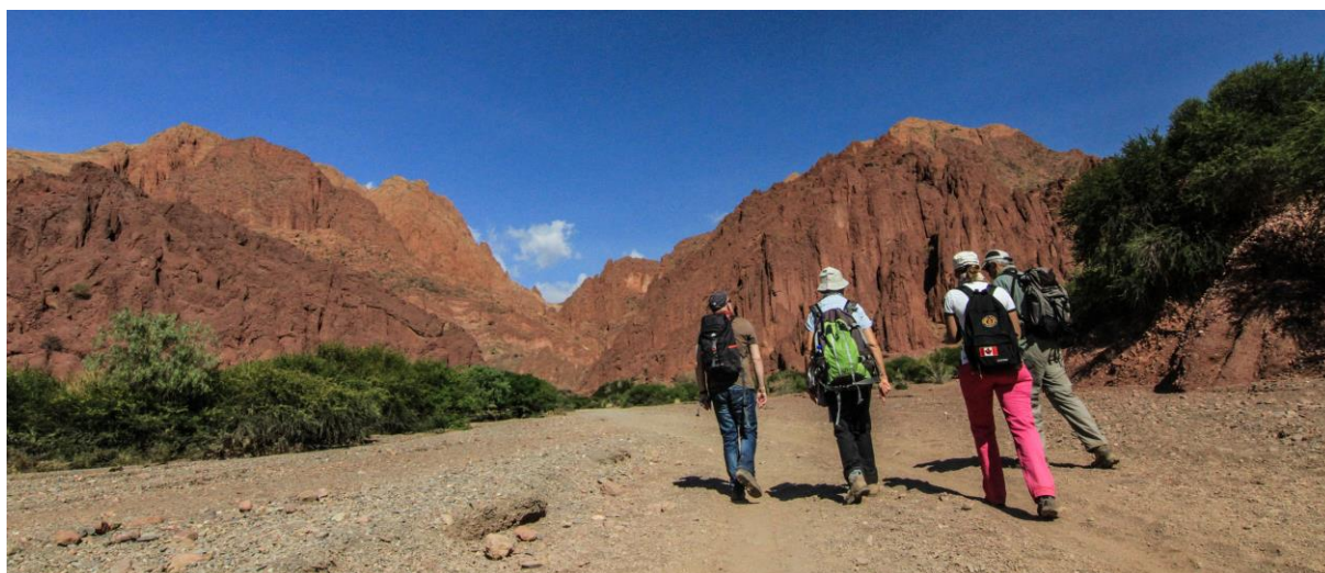
Canyon del Inca - Tupiza

Temps de marche : 4 h 00 si nous réalisons l'intégralité du parcours à pied Déjeuner et dîner libre